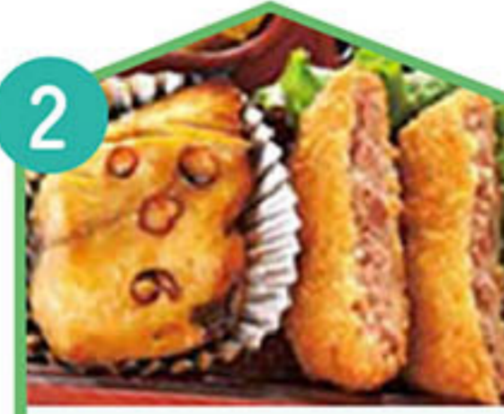
焼き魚・コロッケ