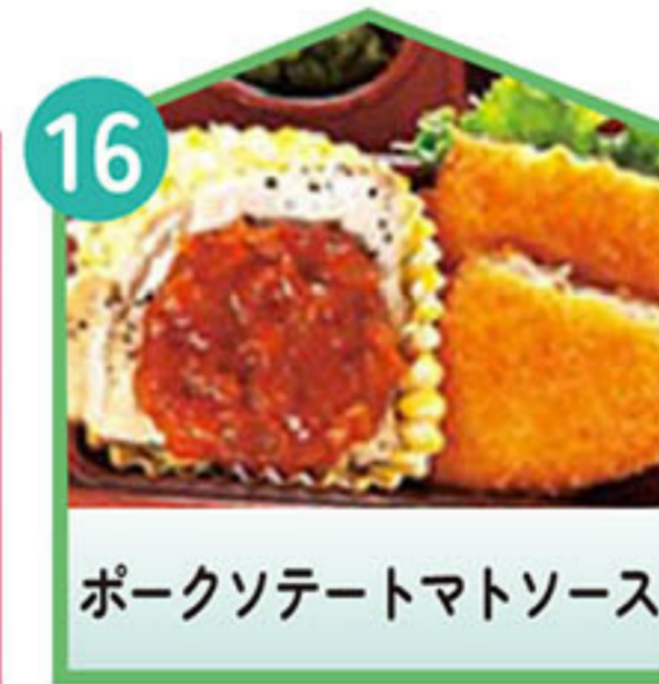
ポークソテートマトソース