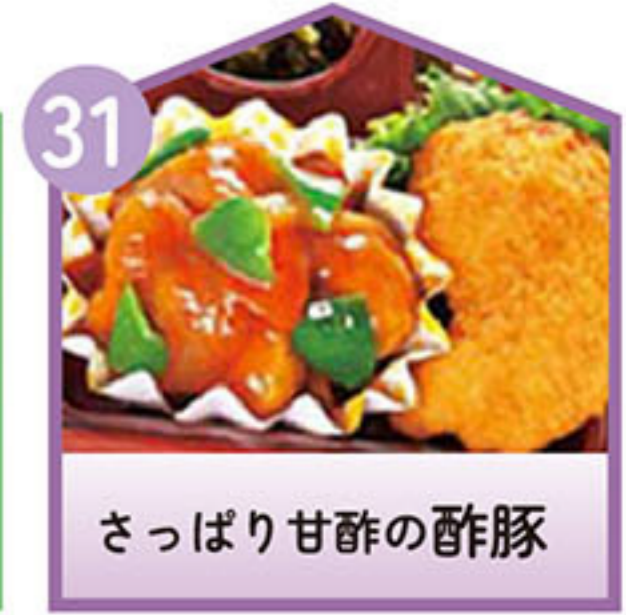
さっぱり甘酢の酢豚