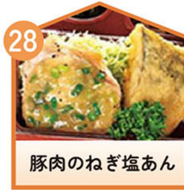
豚肉のねぎ塩あん