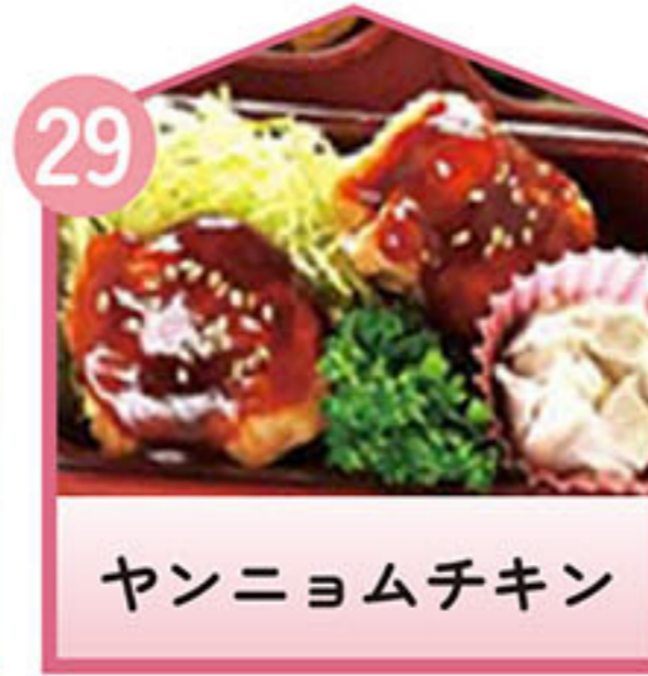
ヤンニョムチキン