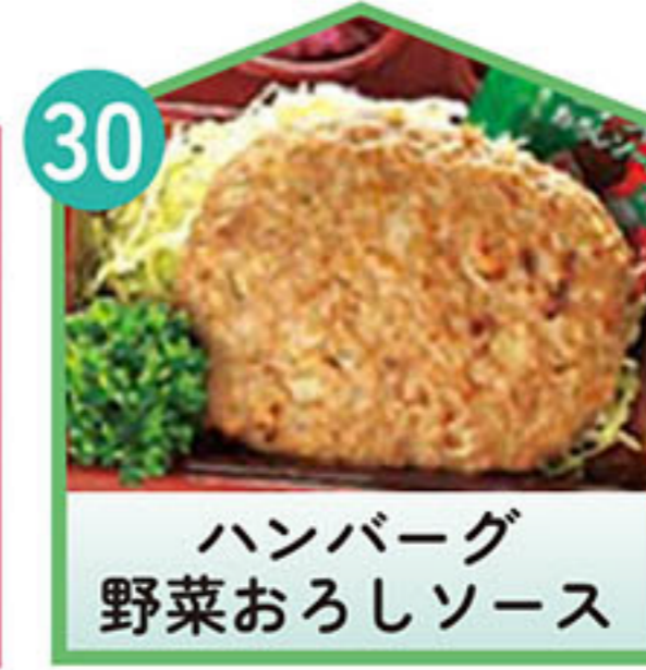
ハンバーグ 野菜おろしソース