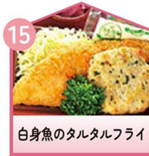
白身魚のタルタルフライ