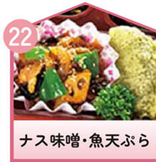
ナス味噌・魚天ぷら