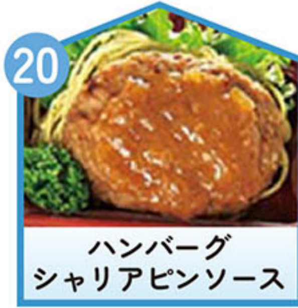
ハンバーグ シャリアピンソース