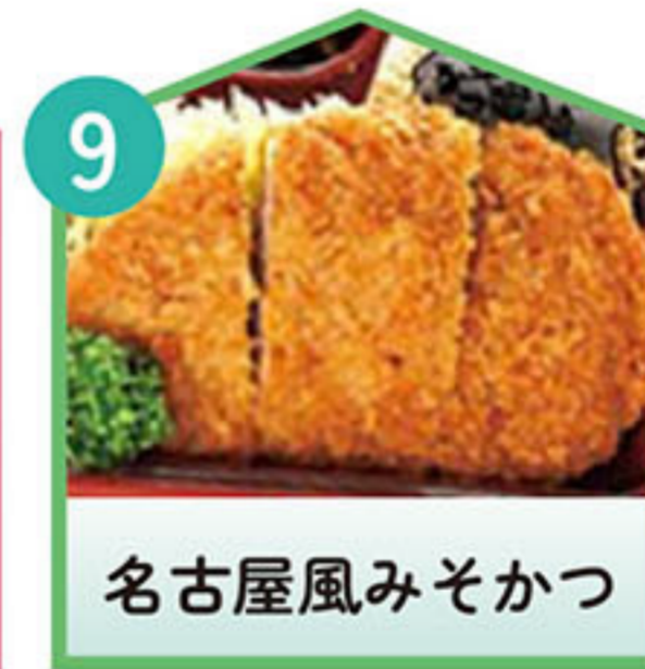
名古屋風みそかつ