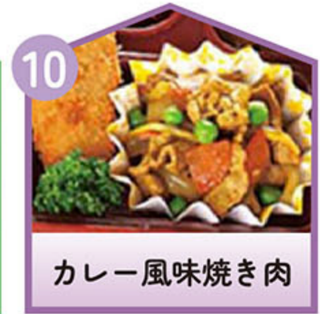
カレー風味焼き肉