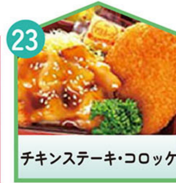
チキンステーキ・コロッケ