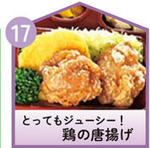
とってもジューシー! 鶏の唐揚げ