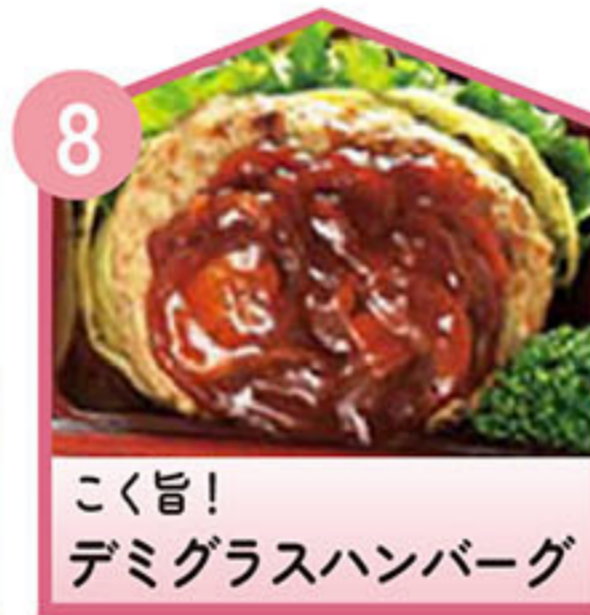
こく旨! デミグラスハンバーグ