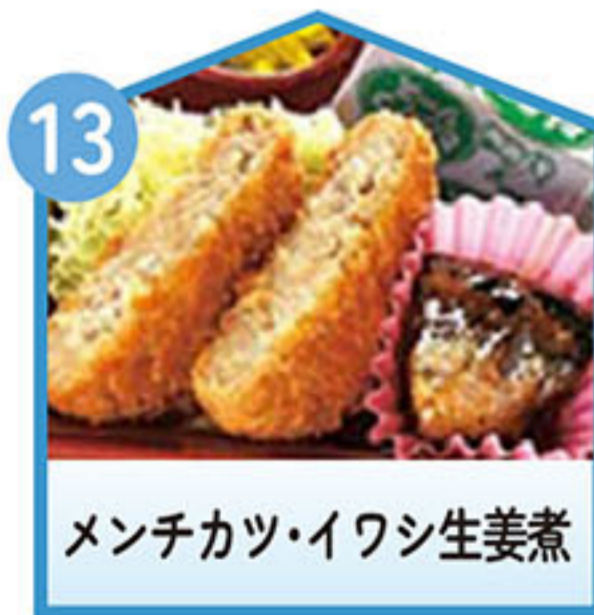
メンチカツ・イワシ生姜煮